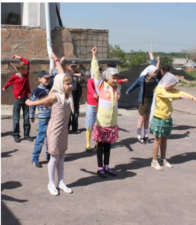
Куда же без зарядки