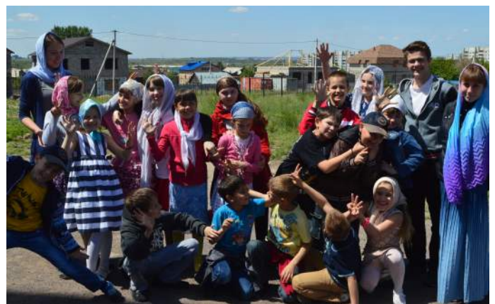
А сколько у нас игр!