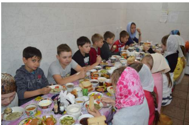
Про обед тоже не забываем