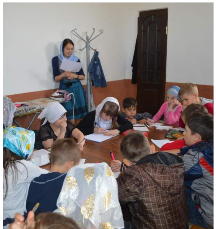
Знания тоже нужны!